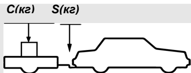
верное размещение груза