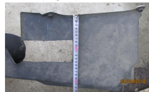
Рис.2 Вырез в левом пыльнике.

4.8. Сделать вырез в левом пыльнике 68х155 мм (см. рис.2).