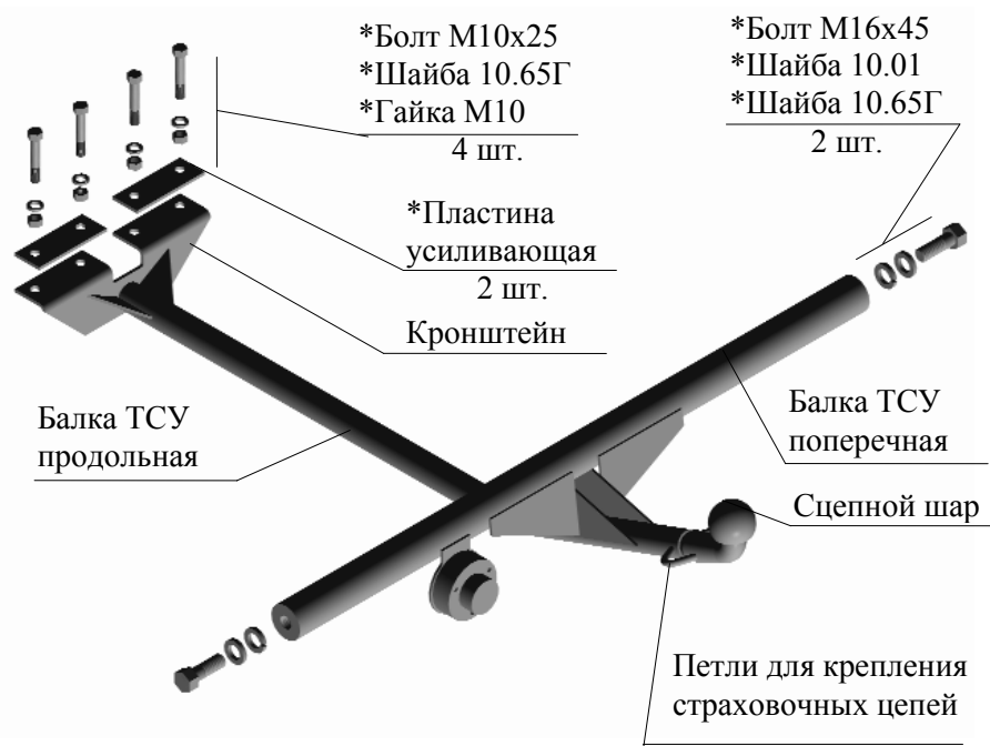
Рис.1 Тягово-сцепное устройство ТСУ 2105

Примечание: детали, помеченные * входят в пакет комплектующих