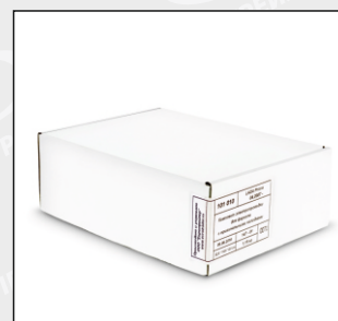
Комплект без футляра (Арт. № 101 010 К)